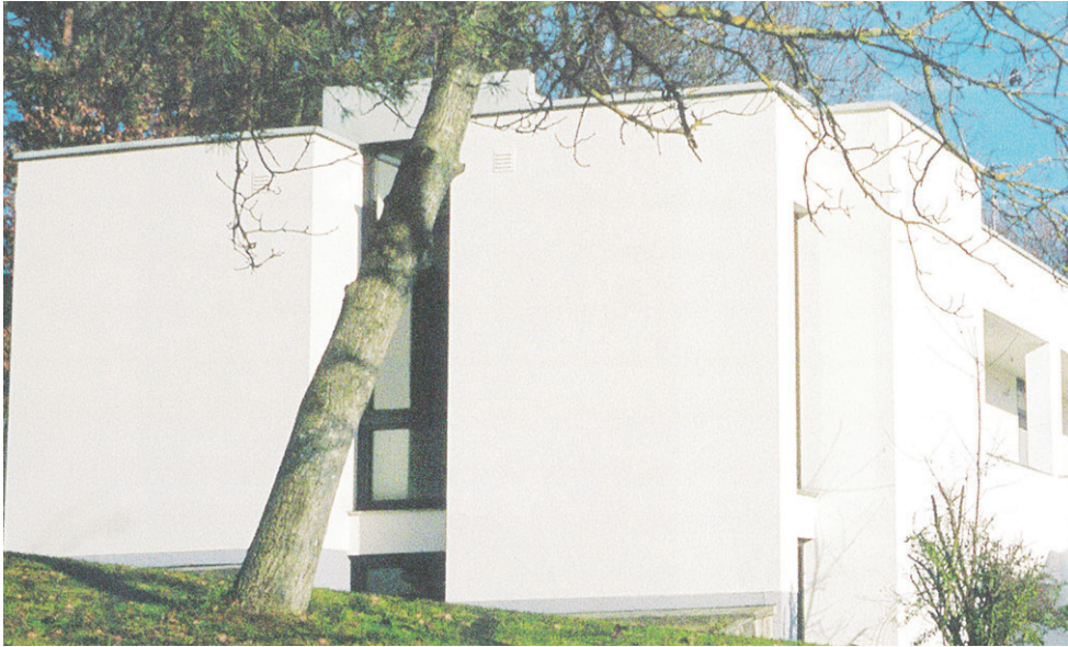
Das „Dellacher-Haus“ wurde 1967 am Stadtrand von Oberwart errichtet.